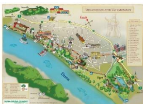
„Vidám Varázslatok Vác Városában” – kincskereső térkép