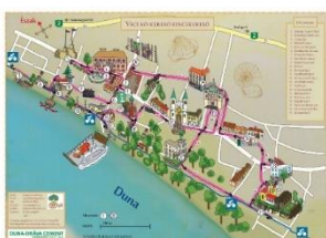
„Váci Kő-kereső Kincskereső”